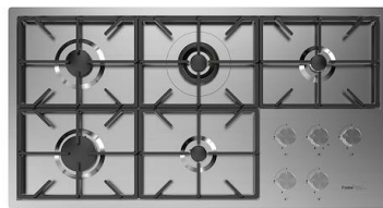
Placa de cocción Foster Milano 7638 000