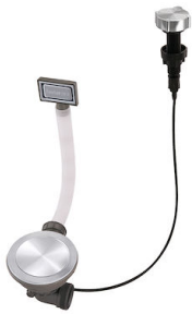
Desagüe automático Space Milano 8407 115