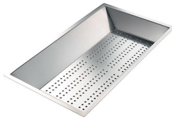
Bandeja perforada inox