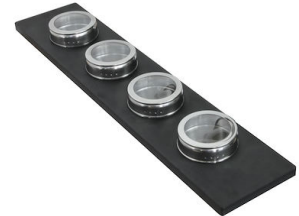
Conjunto de 4 porta-especias