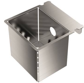
Bandeja perforada inox

* sólo en combinación con el accesorio 8644 101