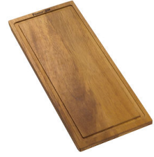
Tabla de corte de madera nogal