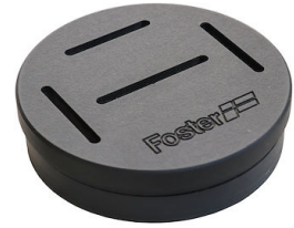
Sujetador de cuchillo 8100 030 * sólo en combinación con el accesorio 8100 621