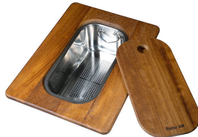
Tabla de corte Twin de madera iroko con escurrir pasta en acero inoxidable 8644 044