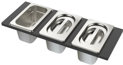
Conjunto de 3 bandejas